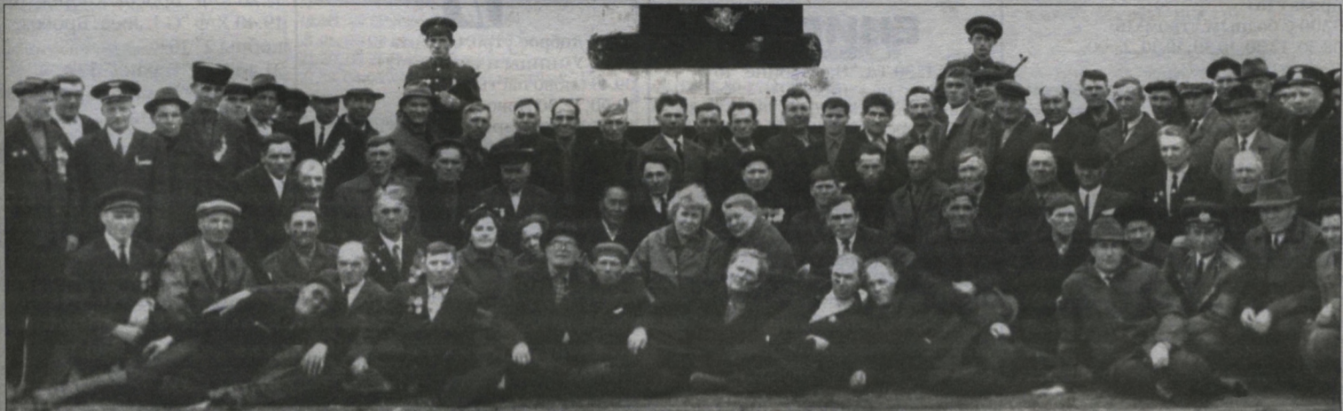
Ветераны Великой Отечественной 9 мая с. Кежма 1971 года